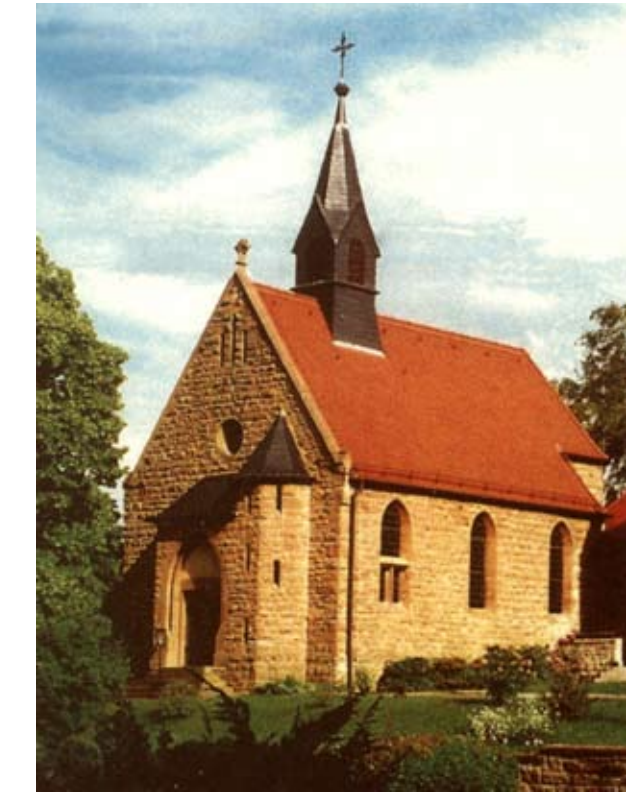
2006 Renovierung der Kirche in Droyßig