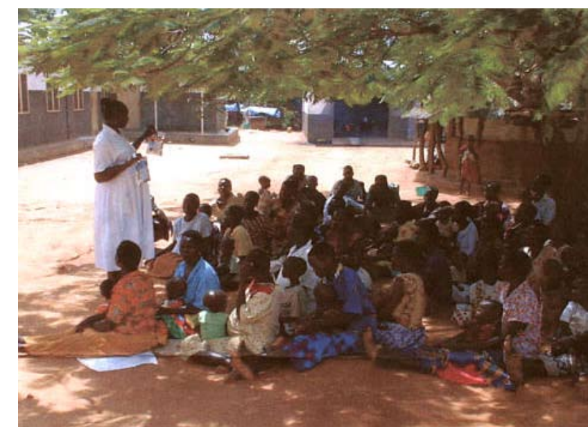
Ab 2000 Jährliche Spendenaktion zur Unterstützung des „Kindermissions-Werkes“ (Projekt PoAmikf Ref) im St. Joseph Krankenhaus Kitgum – Uganda

Am 29.08.1991 beschließt der Hauptausschuß der Stadt, daß das Gemeindezentrum in der Moritzburg an die katholische Gemeinde Zeitz verkauft wird. In dieser Sitzung wurde uns ein Angebot gemacht: Den Kreuzgang als Gemeindezentrum zu übernehmen, was nach unserer Meinung viel organischer und schöner ist. Die Skizze gibt einen Überblick zum geplanten Gemeindezentrum. Am 22.04.1993 wurde der Erbpachtvertrag für das Gemeindezentrum und am 21.01.1994 wurde der Pachtvertrag für den Dom abgeschlossen.