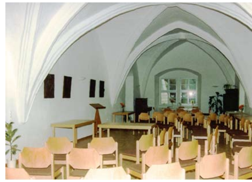
1999 Einzug in das neue Gemeindezentrum