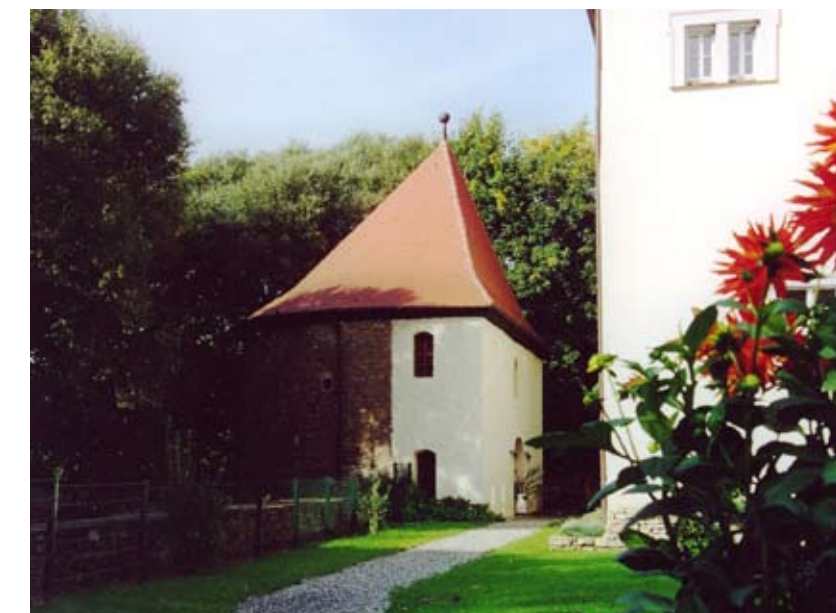
Jugendturm im Gemeindezentrum