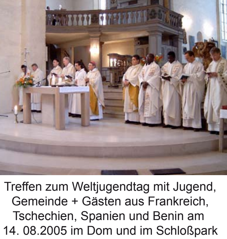
Treffen zum Weltjugendtag mit Jugend, Gemeinde + Gästen aus Frankreich, Tschechien, Spanien und Benin am 14. 08.2005 im Dom und im Schloßpark