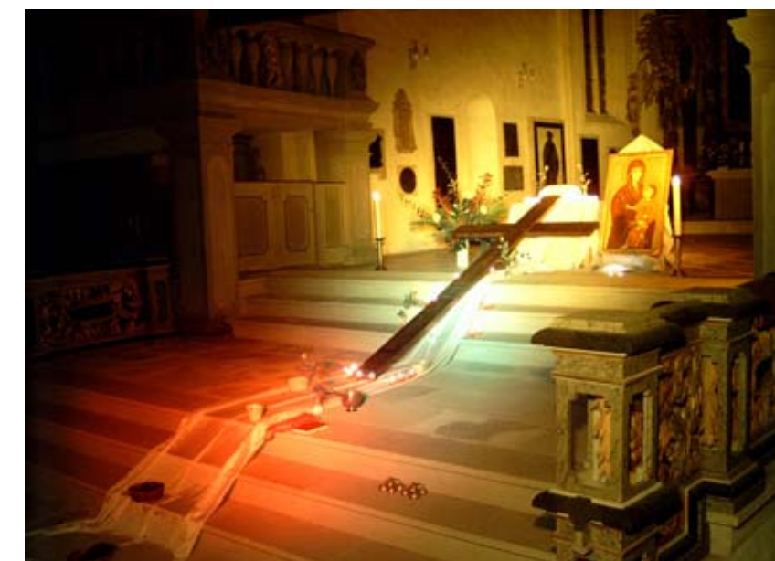
04. und 05.11.2004 Begegnung mit dem Weltjugendtagskreuz