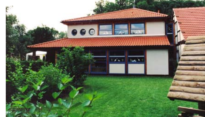
Am 20.12.1995 wird die neu erbaute kath. Kindertagesstätte eröffnet