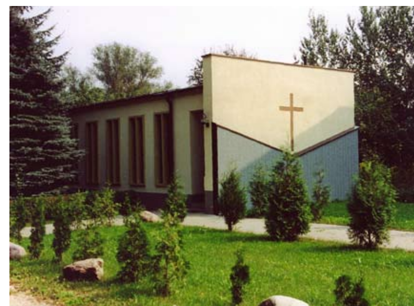
Die neu renovierte Kapelle in Theißen