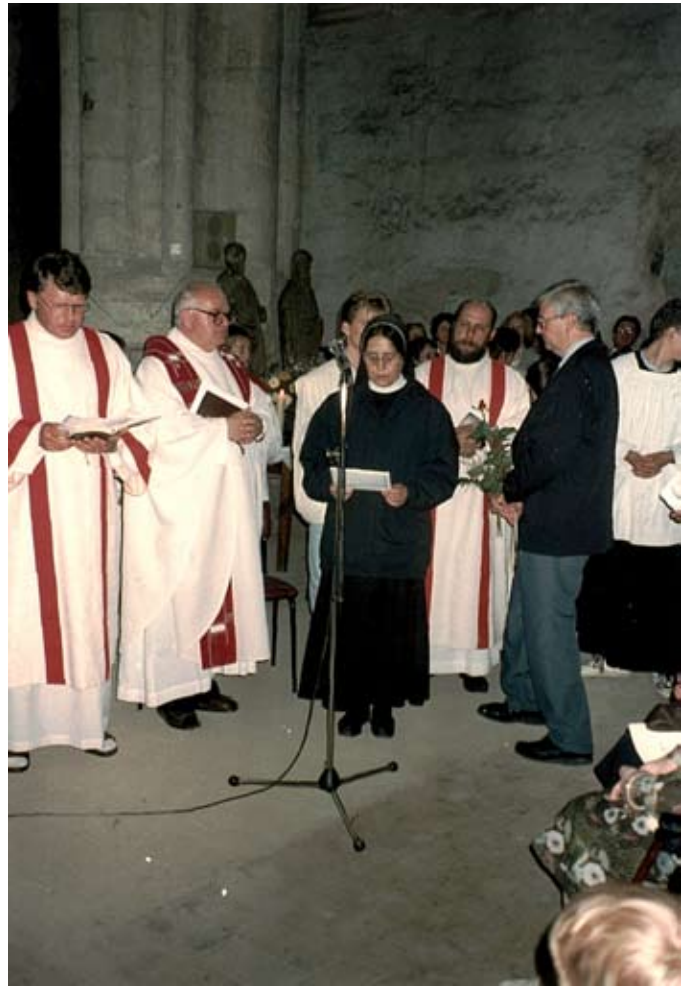
1993 erster Gottesdienst nach der Wende im Dom