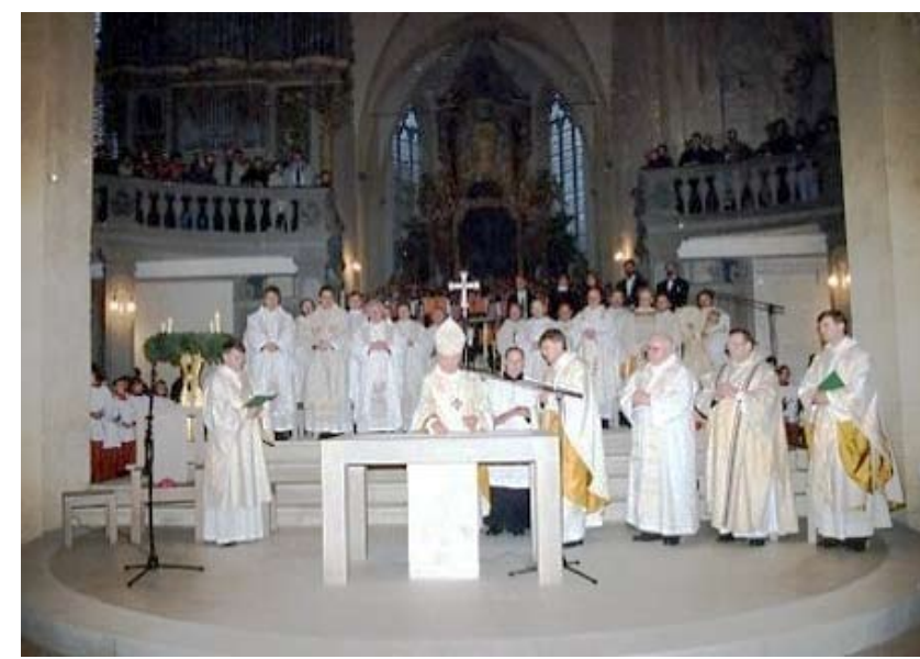
Dom Allarkonsekration am 13.12.1998