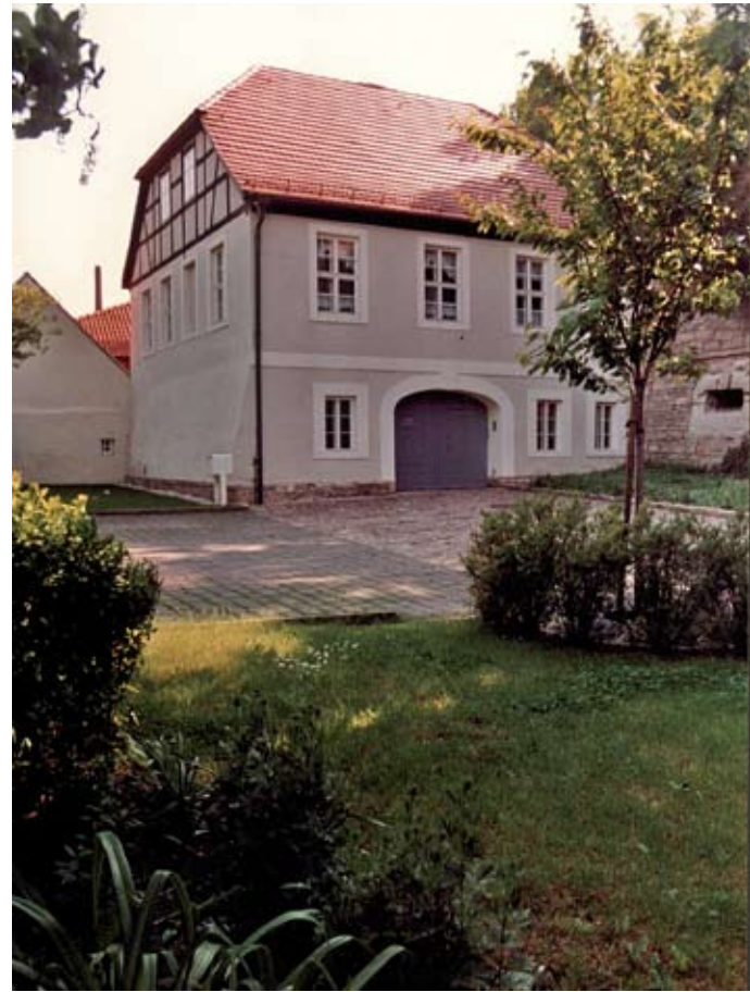
1994 Einzug ins neue Pfarrhaus