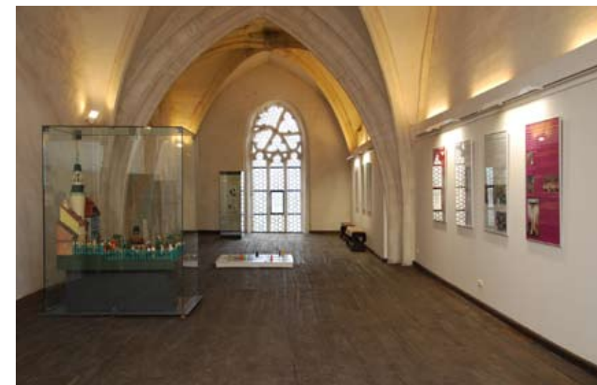
Renovierung des Raumes über der Fürstenloge mit der Dauerausstellung „Das Kirchenjahr“