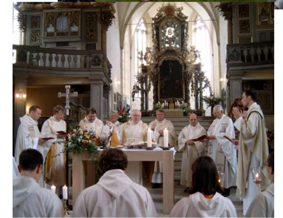
Dekanatswallfahrt Juli 2005 in Zeitz