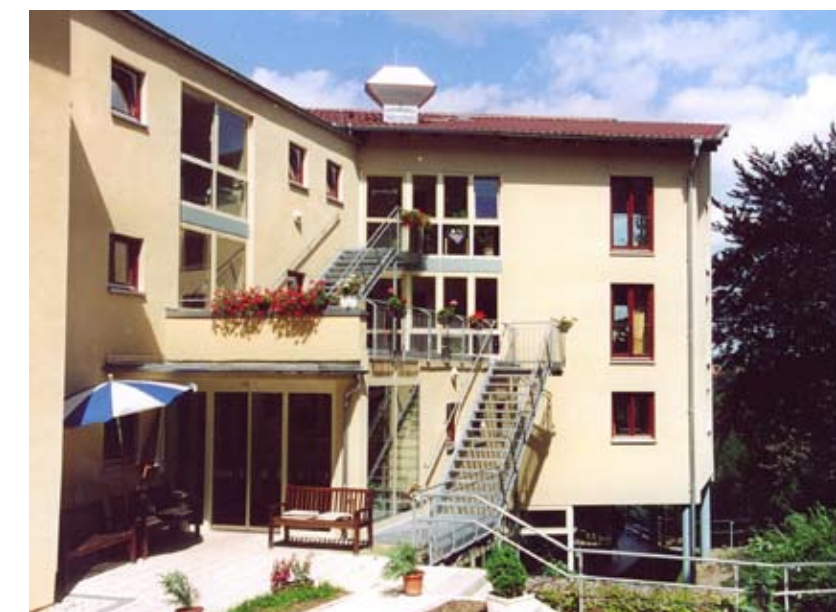
1999 Einweihung des neuen St. Marienstift

Seit 1945 unterhält die katholische Gemeinde in Zeitz einen Kindergarten, der 1995 in den Bereich der Moritzburg umzog. Die Kindertagesstätte ist offen für christliche und nichtchristliche Kinder. Bis zu 54 Kinder im Alter von einem Jahr bis zum Schuleintritt können in altersgemischten Gruppen betreut werden.