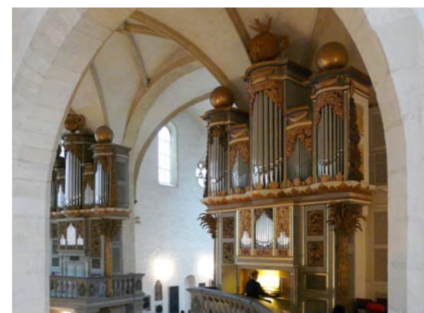
Von 1999 bis 2001 Wiederaufbau der südlichen Orgel durch die Hermann Eule GmbH